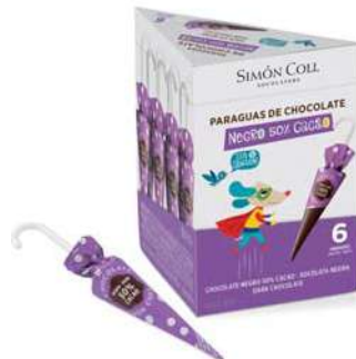
Sombrilla Choc 50% 10g. Caja 6u Referencia: 2214