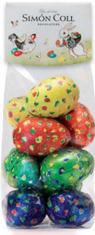
Huevo Eñtaado 25g. B/10 Referencia: 7569