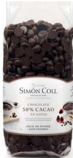
Gotas Choc 50% Blkg y Caja 10kg Ref 1kg: 8539 Ref 10kg: 4020