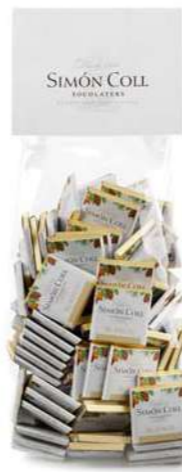
Napolitanas Blanco 5g B100 Ref: 8756