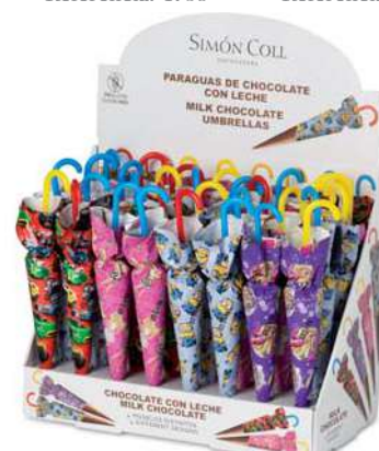
Sombrilla Multilengua 15g. D/32 Referencia: 6843