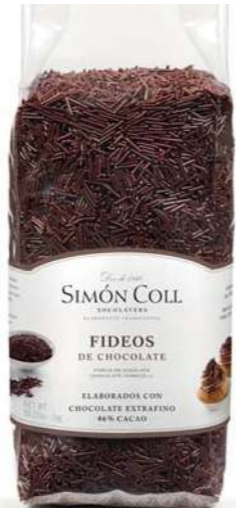
Fideos Choc 45% Blkg Ref: 4100