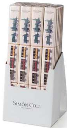
Chocolatira Tren 3x18g. D/24 Referencia: 6294