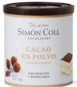
Cacao en Polvo 100g Ref: 5646