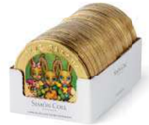
Medallón Pascua 60g. D/25 Referencia: 6782