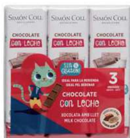
Paqk Choco Leche Niños 3x18g. D/16 Referencia: 2157