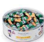
Botella Pequeña 8g. B/60 Referencia: 1023