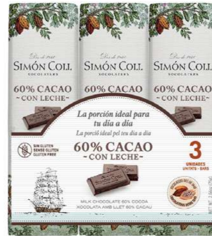
Chocolate 60% con leche 3x25g Ref: 2221