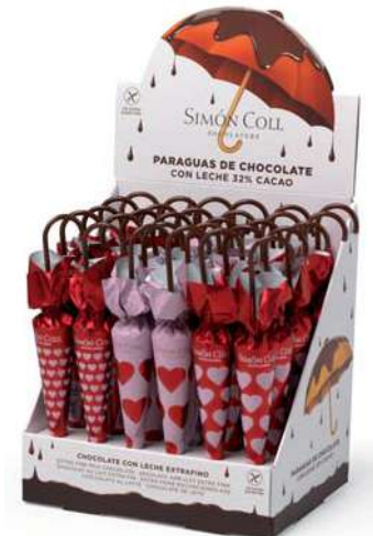
Sombrilla Corazones 35g. D/24 Referencia: 6895