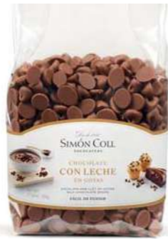
Gotas Choc Leche B500g Ref: 6946