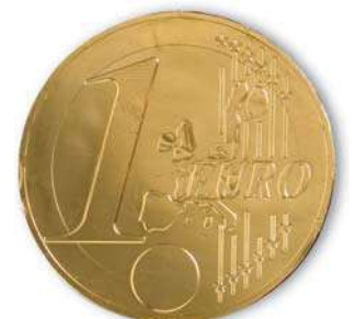
Medallón Gigante 60. B/12 Referencia: 6288