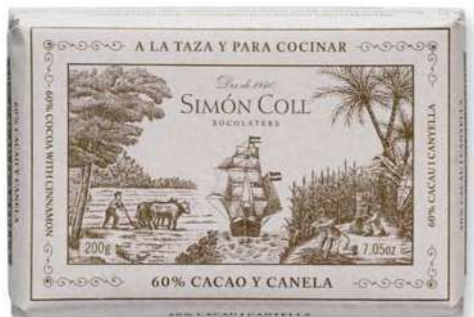
Chocolate a la Piedra 60% Canela 200g Ref: 5592