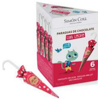
Sombrilla Choc Leche 10g. Caja 6u Referencia: 2212