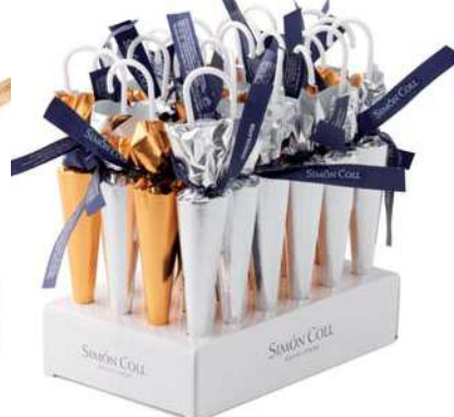
Sombrilla Oro/Plata 35g. D/24 Referencia: 6254