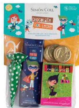
Surtido bolsa pequeña 55g Referencia: 5918