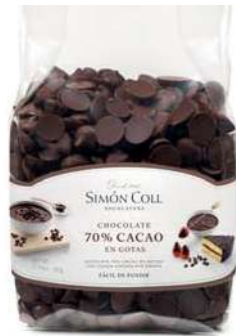
Gotas Choc 70% B500g Ref: 6945