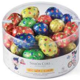
Huevo Eñtaado Bote 40u 15g Referencia: 7326