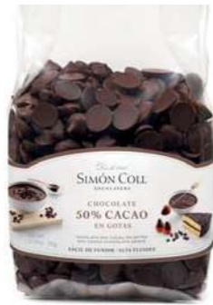
Gotas Choc 50% B500g Ref: 5596