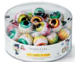
Ojos Halloween 12g. B/40 Referencia: 5963