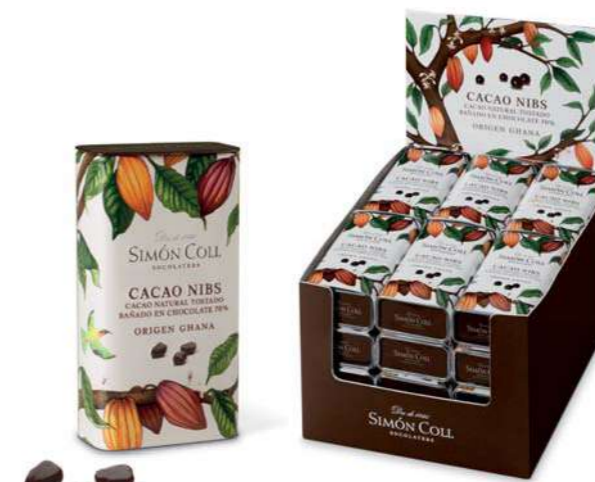
* Cacao Nibs 30g Ref: 5232