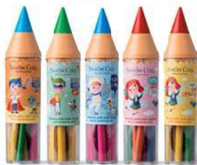
Super Lápiz Colores 30g. D/18 Referencia: 2204