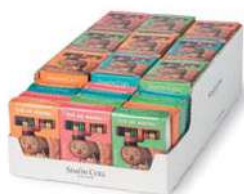
Triopačk Lápisces Tió 60g. D/16 Referencia: 1694