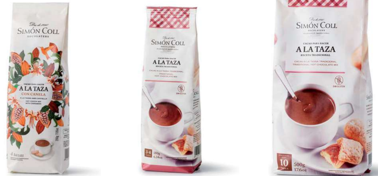
Chocolate a la Taza Barco 28% 200g Ref: 1245