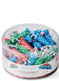
Sombrilla Topos 10g. B/60 Referencia: 1013