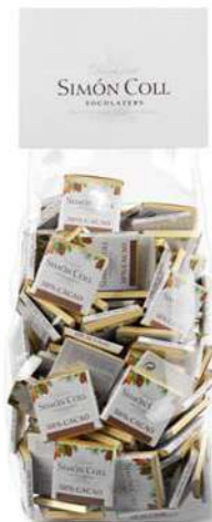
Napolitanas 50% 5g B100 Ref: 8755