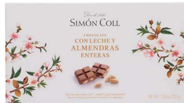
Chocolate con Leche con Almendras Enteras 200g Ref: 7994