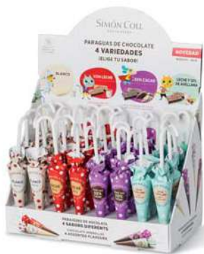
Sombrilla 4 Sabores 10g. D/32 Referencia: 1739