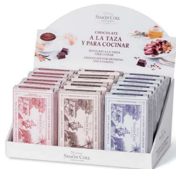
Expositor Surtido Chocolate a la Piedra 18u 3.600g Ref: 5595