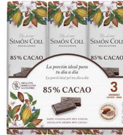
Chocolate 85% 3X25g Ref: 2176