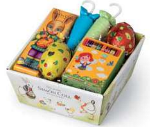
Ceñta Mediana Pascua 88g Referencia: 6784