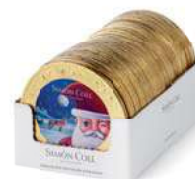
Medallón Papá Noel 60g. D/25 Referencia: 6906