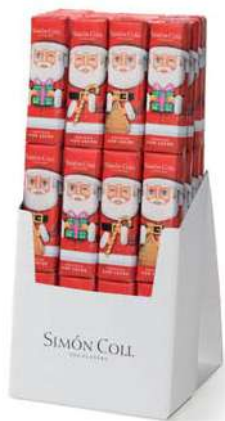
Chocolatira Papá Noel 3x18g. D/24 Referencia: 8860