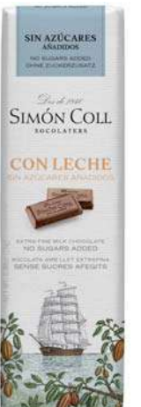
Chocolate con Leche Sin azúcares añadidos 25g Ref: 2179