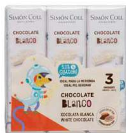
Paqk Choco Blanca Niños 3x18g. D/16 Referencia: 2158