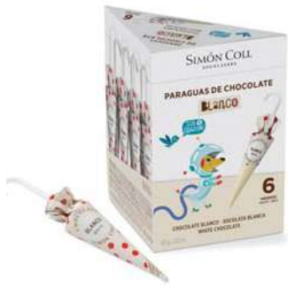
Sombrilla Choc Blanco 10g. Caja 6u Referencia: 2213