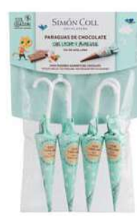
Sombrilla Avellana 10g. Paçk 4u Referencia: 1737