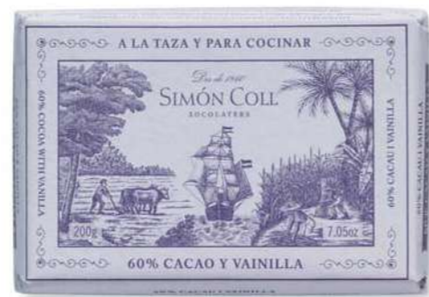
Chocolate a la Piedra 60% Vainilla 200g Ref: 5593