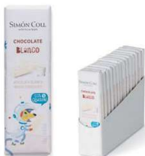
Chocolatinas niños Choc Blanco 18g. D/14 Referencia: 5933