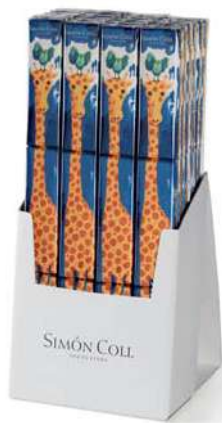
Chocolatira Jirafa 3x18g. D/24 Referencia: 6373