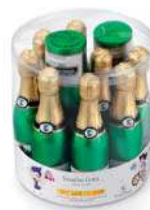
Botella Benjamin 100g. B/10 Referencia: 1031