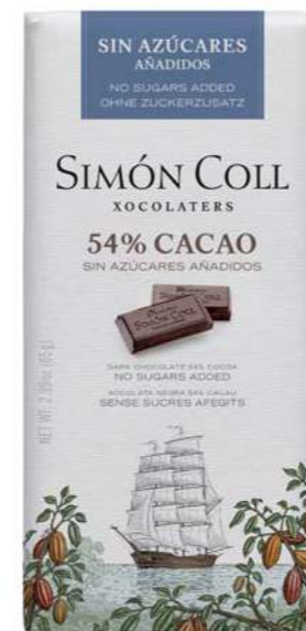
Chocolate 54% Sin azúcares añadidos 85g Ref: 6406