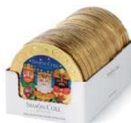
Medallón Reyes 60g. D/25 Referencia: 6907