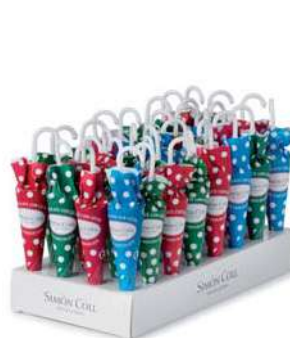
Sombrilla Topos 10g. D/32 Referencia: 6319