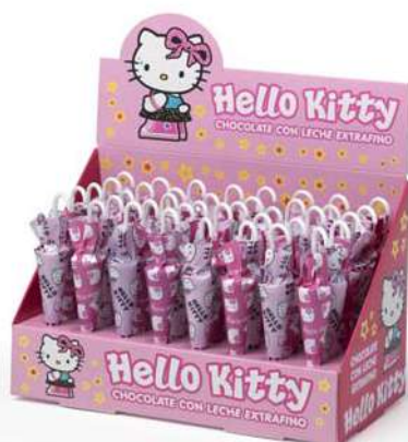
Sombrillas Hello Kitty 10g. D/40 Referencia: 8760