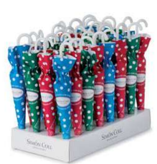
Sombrilla Topos 15g. D/32 Referencia: 6320