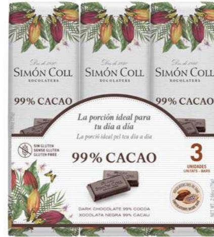
Chocolate 99% 3X25g Ref: 2177