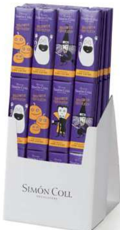
Chocolatira Halloween 3x18g. D/24 Referencia: 8861