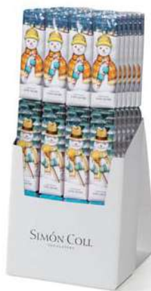
Chocolatira Invierno 3x18g. D/24 Referencia: 6569