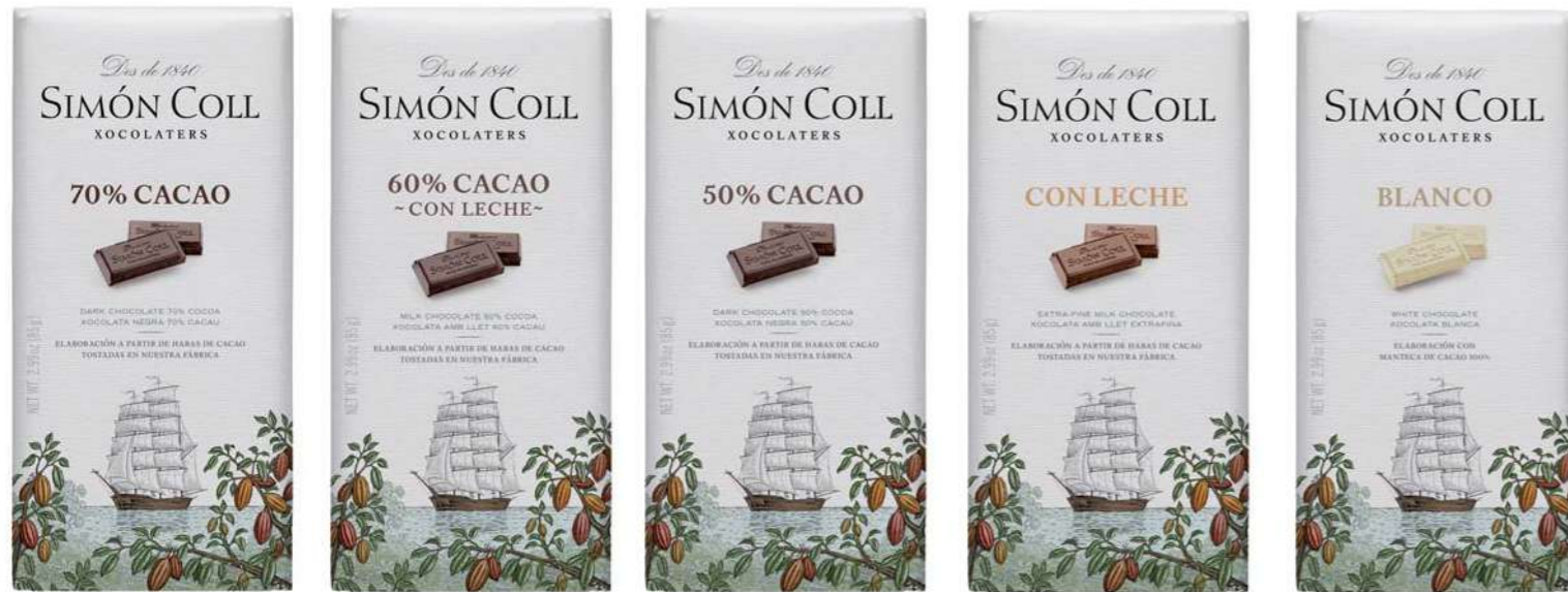
Chocolate 70% 85g Ref: 6262 Chocolate 60% con leche 85g Ref: 2188 Chocolate 50% 85g Ref: 1104 Chocolate con Leche 85g Ref: 1105 Chocolate Blanco 85g Ref: 6261