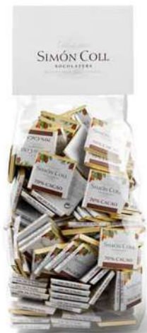
Napolitanas 70% 5g B100 Ref: 8754