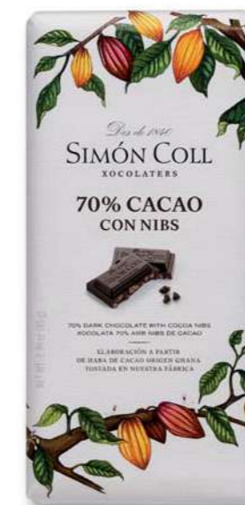
Chocolate 70% con Nibs 85g Ref: 5567