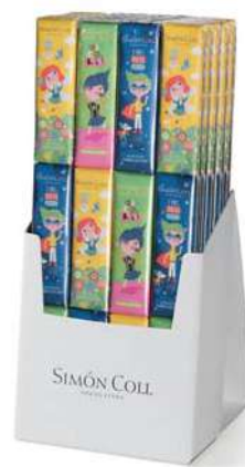
Chocolatira Celebración 3x18g. D/24 Referencia: 8943