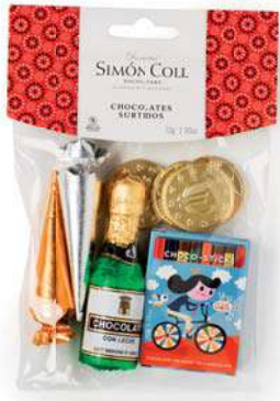
Surtido Bolsa Pequeña 72,4g. Referencia: 1496