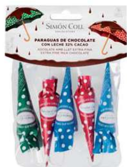
Sombrillas Topos Paçk 5u (50g.) Referencia: 1495