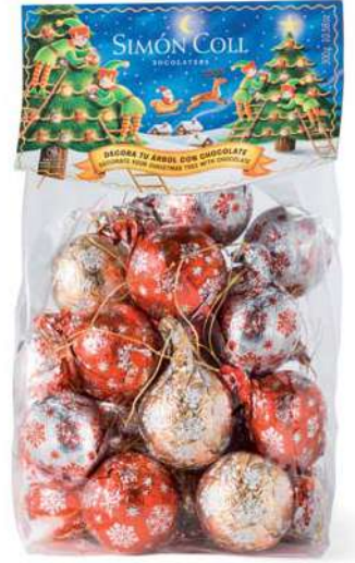
Surtido Bolas Arbol 300g. Referencia: 1354