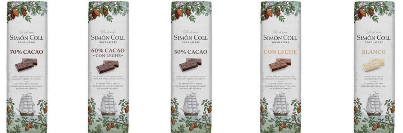
Chocolate 70% 25g Ref: 2180 Chocolate 60% con leche 25g Ref: 2189 Chocolate 50% 25g Ref: 2183 Chocolate con Leche 25g Ref: 2184 Chocolate Blanco 25g Ref: 2185