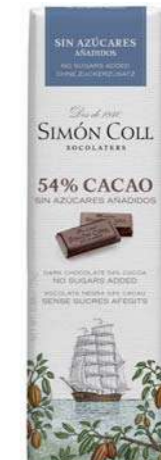
Chocolate 54% Sin azúcares añadidos 25g Ref: 2178