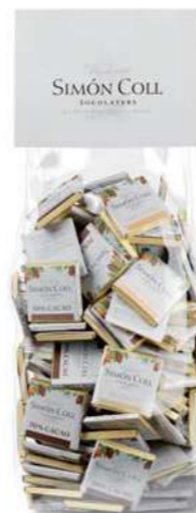
Napolitanas surtidos 5g B100 Ref: 8758