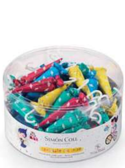
Sombrilla Planetas 8g. B/60 Referencia: 7107