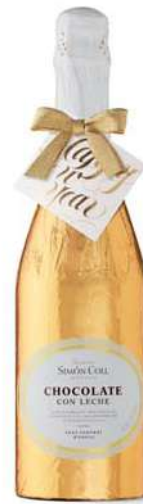
Botella Happy New Year 300g. Referencia: 8537