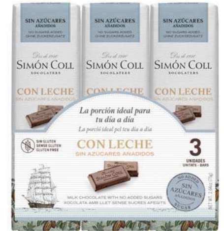
Chocolate con leche sin azuceres añadidos 3x25g Ref: 2173