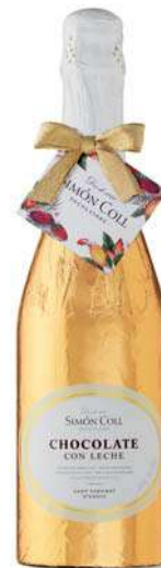
Botella SC 300g. Referencia: 1330