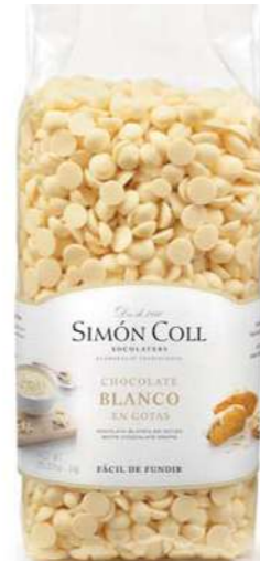
Gotas Choc Blanco Blkg Ref: 8540