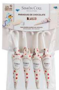
Sombrilla Blanco 10g. Paçk 4u Referencia: 1736