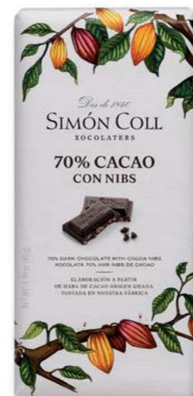
Chocolate 70% con Nibs 85g Ref: 5567