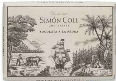
Chocolate a la Piedra 45% Original 200g Ref: 1134