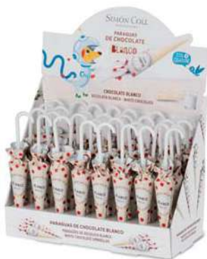
Sombrilla Choc. Blanco 10g. D/32 Referencia: 2224