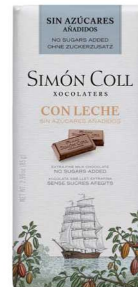
Chocolate con Leche Sin azúcares añadidos 85g Ref: 6407