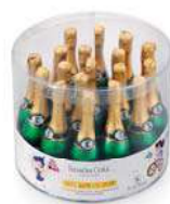
Botella Grande 40g. B/20 Referencia: 1030