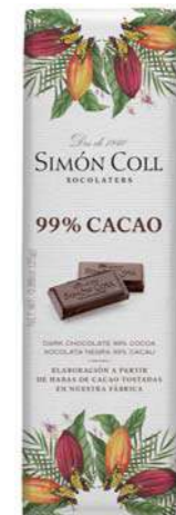
Chocolate 99% 25g Ref: 2182