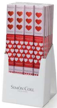
Chocolatira Corazones 3x18g. D/24 Referencia: 5214