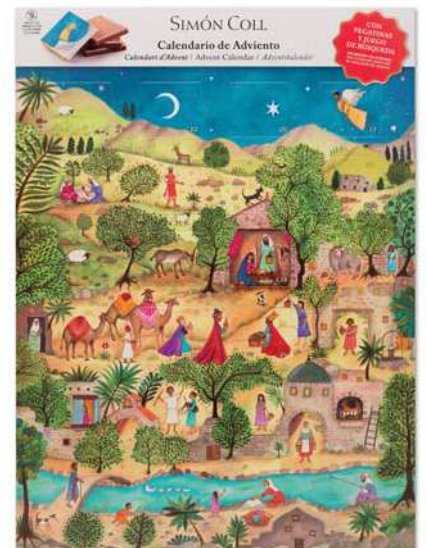
Calendario Adviento SC 120g. D/12 Referencia: 5951