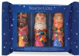
Bandeja Reyes Magos 3u 25g. D/20 Referencia: 7289