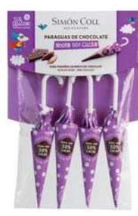
Sombrilla 50% 10g. Paçk 4u Referencia: 1738