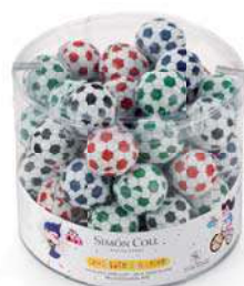
Balones 12g. B/60 Referencia: 7421