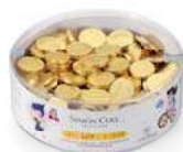
Monedas en Red 50g. Caja 40ud. Referencia: 6451