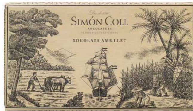
Chocolate con Leche 200g Ref: 1471