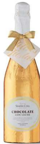
Botella Felices Fiestas 300g. Referencia: 5767