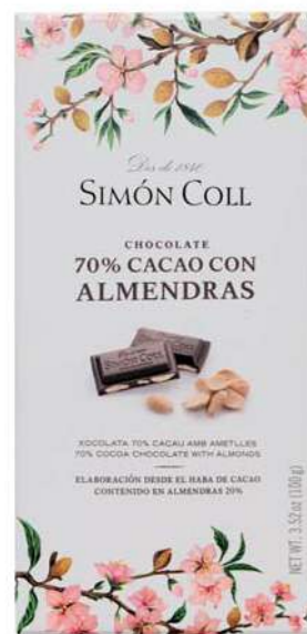
Chocolate 70% con Almendras 100g Ref: 1267