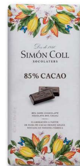
Chocolate 85% 85g Ref: 5565