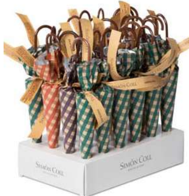
Sombrilla Cuadros 35g. D/24 Referencia: 6096