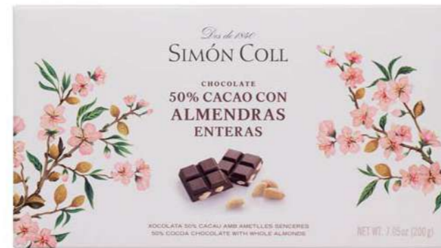
Chocolate 50% con Almendras Enteras 200g Ref: 7993