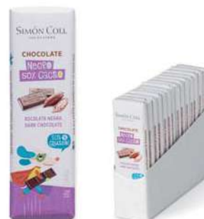
Chocolatinas niños Choc 50% 18g. D/14 Referencia: 5931