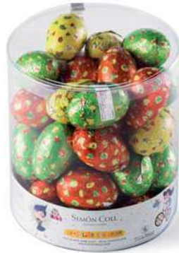
Huevo Eñtaado Bote 40u 25g Referencia: 7487