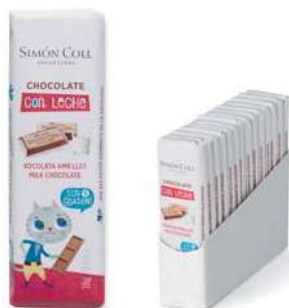
Chocolatinas niños Choc Leche 18g. D/14 Referencia: 5932