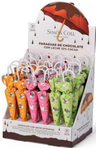
Sombrilla Pascua 35g. D/30 Referencia: 6818