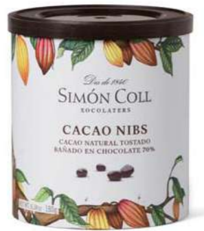
Cacao Nibs 180g Ref: 5644