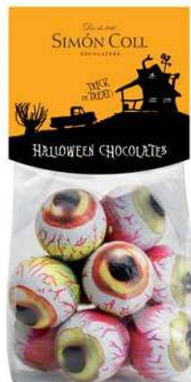
Ojos Halloween 12g. D/15 Referencia: 8794