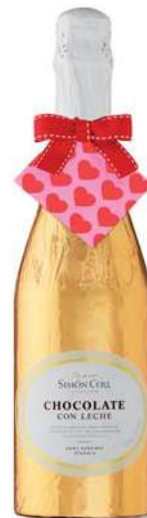
Botella Corazones 300g. Referencia: 5769