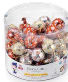
Bolas Navidad 12g. B/50 Referencia: 7530