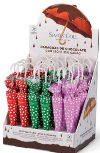
Sombrilla Topos 35g. D/30 Referencia: 6910