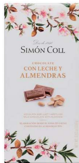
Chocolate con Leche y Almendras 100g Ref: 1268