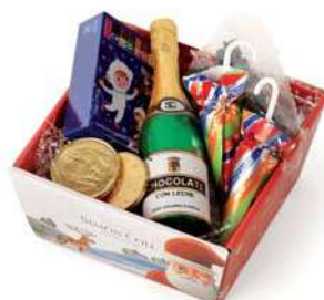
Cesta Mediana 106g. Referencia: 1505