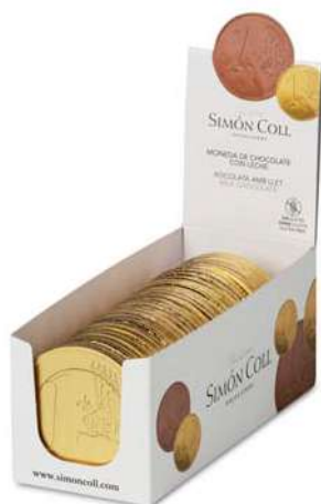
Medallón Mediano 20g. D/36 Referencia: 1140