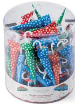
Sombrilla Topos 15g. B/60 Referencia: 1020