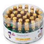
Botella Pequeña 18g. B/30 Referencia: 1027