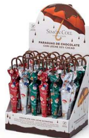
Sombrilla Navidad 35g. D/30 Referencia: 6844