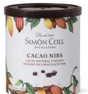
Cacao Nibs 180g Ref: 5644