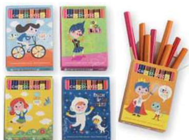
Choco-Sticks 20g. D/45 Referencia: 9593