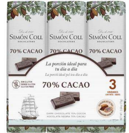
Chocolate 70% 3X25g Ref: 2174