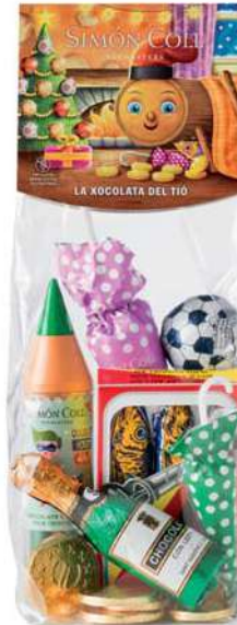
Surtido Caga Tió 151g. Referencia: 1349