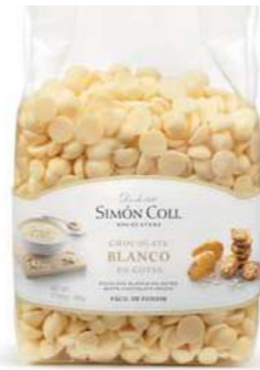
Gotas Choc Blanco B500g Ref: 5597