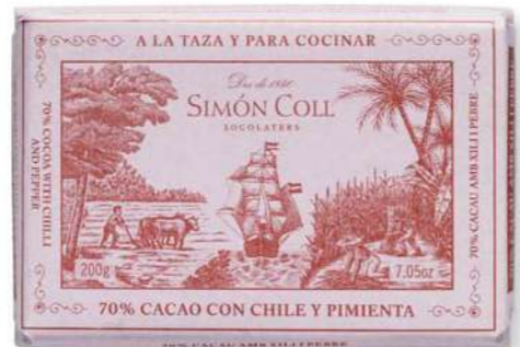
Chocolate a la Piedra 70% Chili y Pimienta 200g Ref: 5594