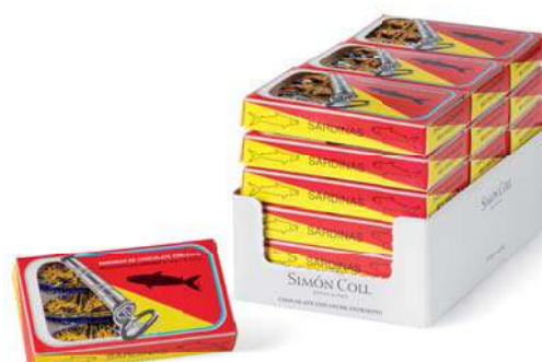
Latas de Sardinas 24g. D/18 Referencia: 7093