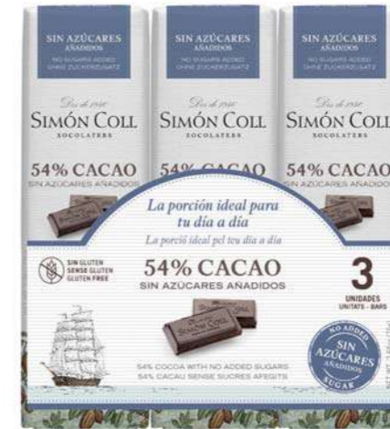
Chocolate 54% sin azuceres añadidos 3x25g Ref: 2172