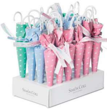
Sombrilla Pastel 35g. D/24 Referencia: 6097