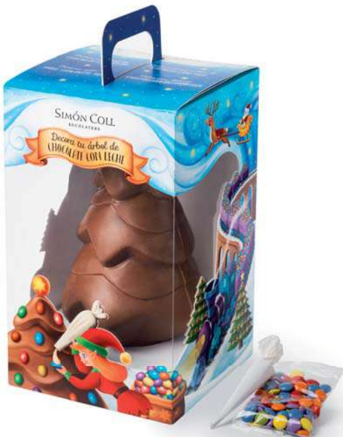
Árbol Navidad Decora 365g. Referencia: 1689