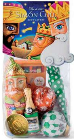
Surtido Bolsa Mediana 119g. Referencia: 7378