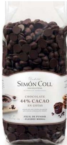
Gotas Choc 44% Blkg y Caja 10kg Ref 1kg: 8538 Ref 10kg: 4010