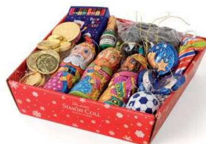
Cesta Grande 202g. Referencia: 1506