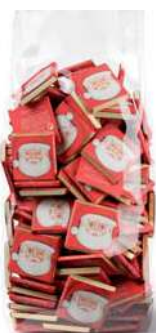
Napitanas 5g. Papá Noel B/100 Referencia: 8974