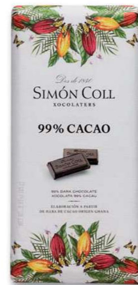
Chocolate 99% 85g Ref: 5566