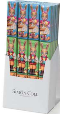
Chocolatira Pascua 3x18g. D/24 Referencia: 5222