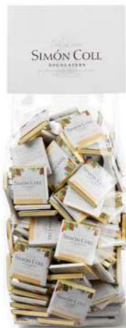
Napolitanas leche 5g B100 Ref: 8753