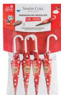
Sombrilla LeChe 10g. Paçk 4u Referencia: 1735