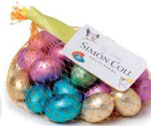
Huevos Rellenos Praliné Red 150g Referencia: 6813 *Puede contener trazas de Gluten