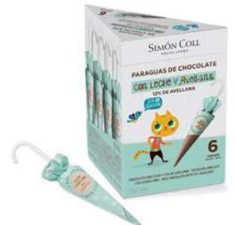
Sombrilla Avellana Blanco 10g. Caja 6u Referencia: 2215