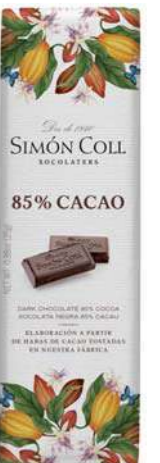
Chocolate 85% 25g Ref: 2181