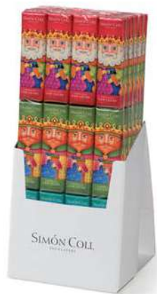
Chocolatira Reyes 3x18g. D/24 Referencia: 8859